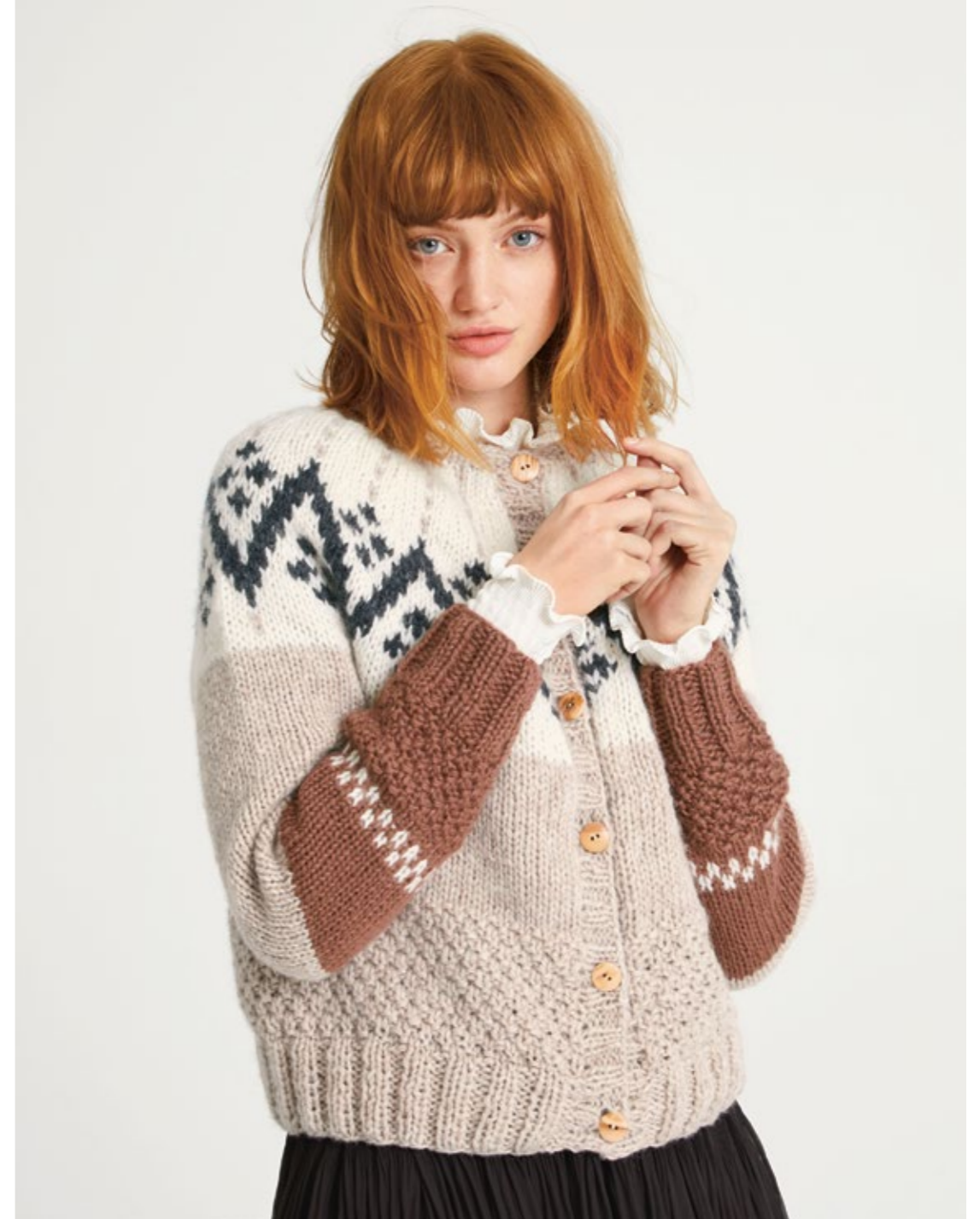
④ FRITIDSGARN | x 7 | 13/10 | BURSFJELL JAKKE XS - XXL