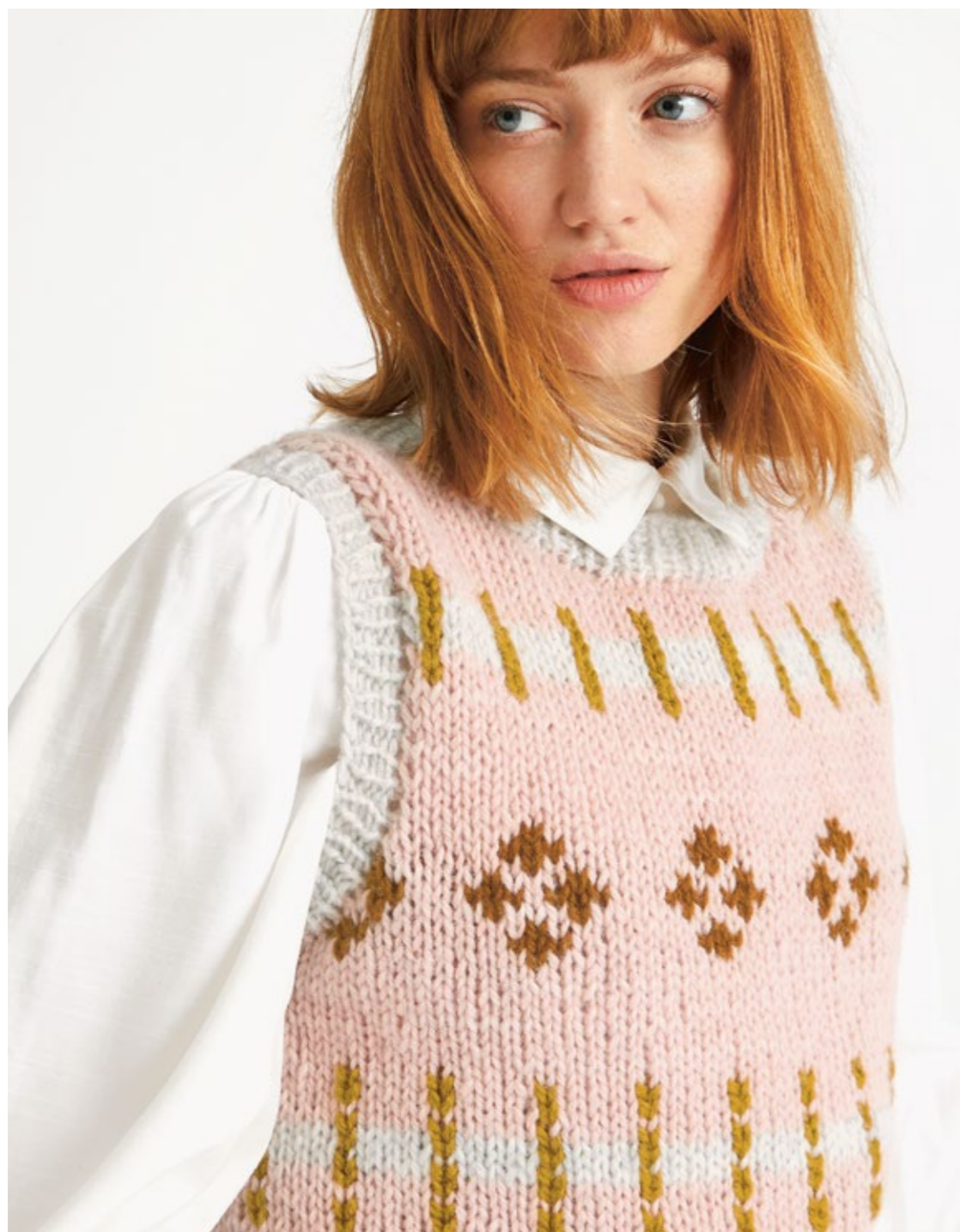
① FRITIDSGARN | x 7 | 13/10 | SKOGAFJELL VEST XS - XXL