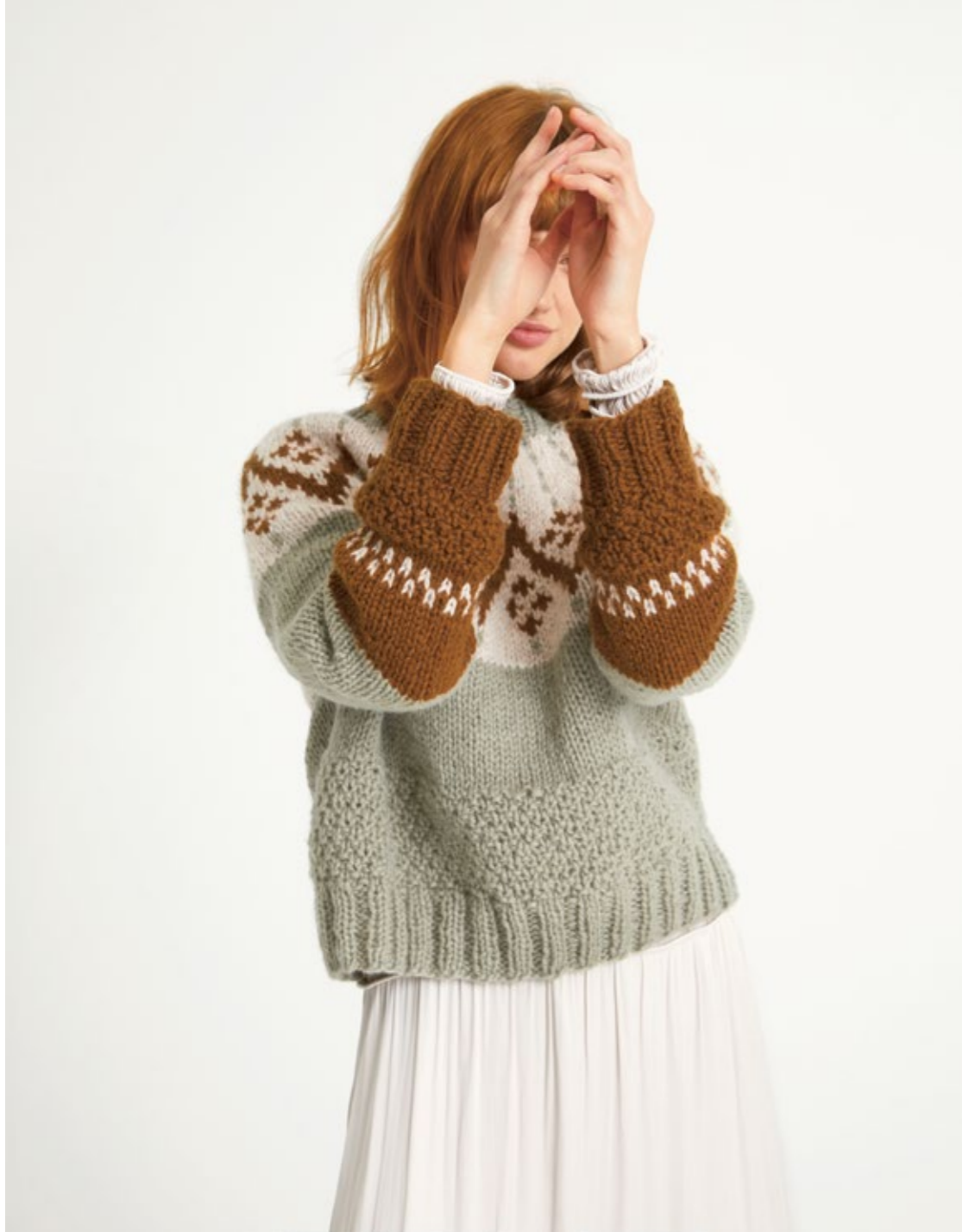
③ FRITIDSGARN | x 7 | 13/10 | BURSFJELL GENSER XS - XXL