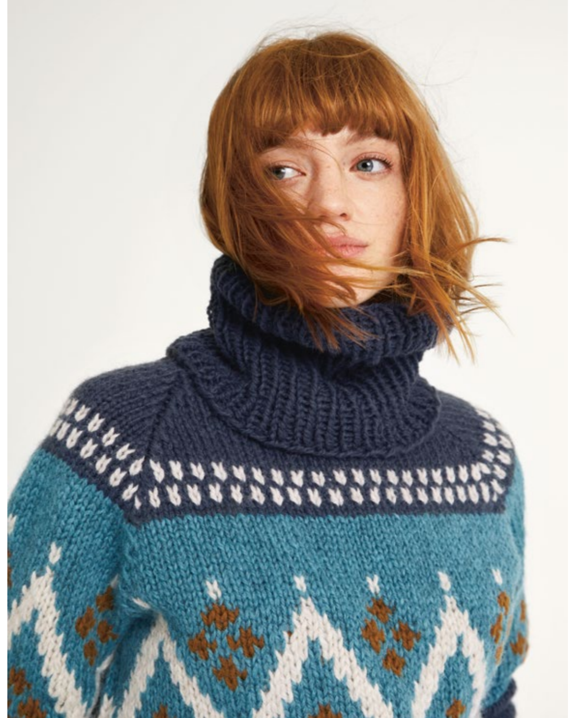
② FRITIDSGARN | x 7 | 13/10 | BLÅFJELL GENSER XS - XXL